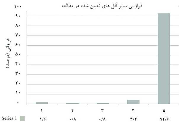
نمودار ۱: فراوانی سایر آلل‌های تعیین شده در مطالعه

سپاسگزاری: این مقاله حاصل پایان‌نامه و طرح تحقیقاتی تحت عنوان "بررسی فراوانی آلل HLA-B*57:01 در بیماران HIV مثبت مراجعه‌کننده به مرکز مشاوره بیماری‌های رفتاری بیمارستان امام خمینی در سال ۱۳۹۱" در مقطع دکترای تخصصی بیماری‌های عفونی و گرمسیری در سال ۱۳۹۲ و کد پایان‌نامه ۲۰۵ و کد طرح ۱۷۳۴۹-۵۵-۰۱-۹۱ می‌باشد که با حمایت مرکز تحقیقات ایدز ایران، مرکز مشاوره بیماری‌های رفتاری بیمارستان امام خمینی و گروه بیماری‌های عفونی و گرمسیری دانشگاه علوم پزشکی و خدمات بهداشتی درمانی تهران اجرا شده است.