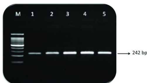
شکل ۱: محصول PCR حاصل از تکثیر پروموتور ژن لپتین

لپتین است که مشخص شده با تغییرات در سطح لپتین در گردش ارتباط دارد. ۲۱ Mammes و همکاران، اولین کسانی بودند که پلی مورفیسم G-2548A را در ناحیه پروموتور ژن لپتین شناسایی کردند و گزارش کردند که این پلی مورفیسم نه تنها بیان ژن لپتین را تحت تأثیر قرار می‌دهد بلکه با چاقی نیز ارتباط مستقیم دارد. ۲۲ پروموتور ژن لپتین در انسان شامل ۲۵۰۰ جفت باز و تعدادی جایگاه اتصال برای فاکتورهای رونویسی است. ۲۳ از جایگاه ژنی LEP-2548G/A تاکنون هیچ نقشه‌ای به‌دست نیامده اما نزدیک به موتیف اتصال SP1 (CCC GCCT; -2539/-2534) قرار دارد که به وسیله آن شناخته شده است. ۲۴