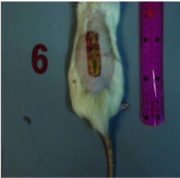
شکل ۵: زخم در روز پانزدهم در گروه سیلور سولفادیازین