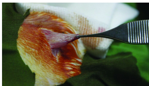
شکل ۱: برداشتن چربی اینگوینال برای تهیه سلول بنیادی