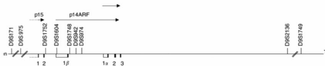
شکل ۱: آرایش اگزون‌های (1a, 1b, 2, 3) ژن CDKN2A بر روی ناحیه کروموزومی 9p16

ژن CDKN2A (Cyclin-dependent kinase inhibitor 2A)، (p16 و MTS1, INK4A) با چهار اگزون (1a, 1b, 2, 3) بر روی ناحیه کروموزومی 9p16 قرار گرفته است (شکل ۱). رونوشت رمزکننده CDKN2A با اگزون 1b آغاز می‌شود. ۱۸،۱۷ پروتیین CDKN2A به‌وسیله مهار مجموعه پروتیینی cyclinD- Cdk4/6 موجب توقف چرخه یاخته در فاز G0 یا G1 می‌گردد. مهار Cdk4/6 به‌وسیله CDKN2A همچنین موجب کاهش سطح