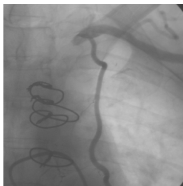
شکل ۱- آنژیوگرافی قوس آئورت: انسداد شریان ساب کلاوین چپ

با توجه به افزایش کراتینین به طور پیشرونده در زمان بستری (تا حد 3/5 \text{mg/dl} ) کاپتوپریل قطع شد و بیمار مورد بررسی کلیوی قرار گرفت که سونوگرافی کلیه و مجاری ادراری نرمال بود. MRI آئورت شکمی پلاک‌های متعدد در آئورت شکمی و تنگی بسیار شدید در محل دو شاخه شدن آئورت نزولی با گسترش به شریان‌های ایلیاک مشترک دو طرف را نشان داد و در ابتدای شریان‌های کلیوی دو طرف نیز در هر دو طرف تنگی قابل توجه دیده شد. در اسکن DTPA برای بررسی عملکرد کلیوی در کلیه راست \text{GFR}=21 \text{ml/min} و در کلیه چپ \text{GFR}=12 \text{ml/min} گزارش شد. بیمار مورد آنژیوگرافی قوس آئورت و کرونر قرار گرفت که شریان ساب کلاوین چپ 1 \text{cm} پس از جدا شدن از قوس آئورت به طور کامل مسدود شده بود (شکل ۱). گرافت LIMA به طور معکوسی به شریان ساب کلاوین چپ خون-رسانی می‌کرد (شکل ۲). شریان‌های کرونر تنگی جدیدی را نشان ندادند و سایر گرافت‌های وریدی باز بودند. در بولب شریان کاروتید داخلی چپ پلاک 40-50\% درصد و در بولب کاروتید راست تنگی مختصری دیده شد. شریان ساب کلاوین راست نیز پلاک‌های متعدد آترواسکلروز داشت. در آنژیوگرافی، شریان کلیوی راست تنگی 60-70\% درصد و سمت چپ تنگی 85\% درصد در منشاء شریان داشت که شریان کلیوی چپ، طبق توصیه نفرولوژیست آنژیوپلاستی و استنت گذاری شد. جهت برقراری جریان خون ساب کلاوین چپ جراحی بای پس ساب کلاوین به ساب کلاوین با گورتکس انجام شد.