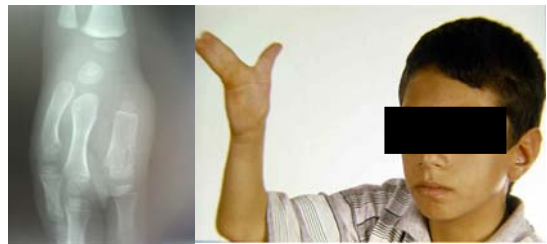
شکل - ۱: بیمار ۱۲ ساله با سینداکتیلی انگشتان