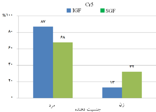
نمودار ۲: مقایسه فراوانی SGF در دو گروه با دهنده مذکر و مؤنث