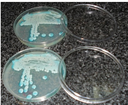
شکل ۲: کلنی سبز رنگ کاندیدا آلبیکنس بر روی محیط کروم آگار کاندیدا پس از انکوباسیون در دمای ۳۵ °C به مدت ۷۲ ساعت

جداسازی و شناسایی اولیه گونه‌های کاندیدا بر اساس رنگ کلنی بر روی محیط کروم آگار بود. به این ترتیب سه ایزوله با کلنی آبی متالیک به‌عنوان کاندیدا تروپیکالیس (شکل ۱)، هفت ایزوله با کلنی سبز به‌عنوان کاندیدا آلبیکنس (شکل ۲) و ۱۰ ایزوله با کلنی صورتی با هاله سفید به‌عنوان کاندیدا پاراپسیلوزیس (شکل ۳) شناسایی شدند ولی کلنی‌های سه ایزوله دیگر قابل تشخیص نبود.