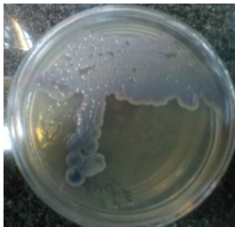
شکل ۱: کلنی آبی متالیک کاندیدا تروپیکالیس بر روی محیط کروم آگار کاندیدا پس از انکوباسیون در دمای ۳۵ °C به مدت ۷۲ ساعت