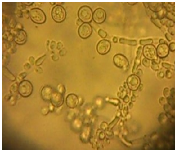
شکل ۴: کلیمیدوکونیدی، میسلیم و بلاستوکونیدی‌های کاندیدا آلبیکنس روی محیط کورن میل آگار+ توین ۸۰ (با درشت‌نمایی ۴۰۰)