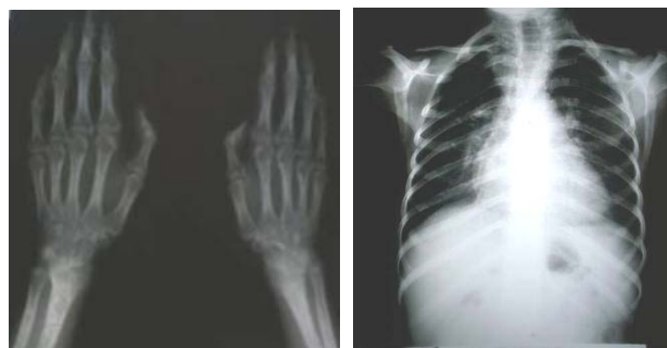
شکل ۳: عکسهای رادیولوژی بیمار

با توجه به یافته‌های بالینی خاص بیمار شامل کوتاهی قد، آترواسکلروز زودرس و ظاهر پیر (premature aging) در بانک اطلاعاتی Medline با استفاده از کلمات کلیدی فوق جستجو صورت گرفت. تشخیص‌های احتمالی شامل سندرم‌های HGPS و Werner و Metageria مطرح می‌باشند. قندهای ناشتای طبیعی، کوتاهی قد قابل توجه، استئولیز، بیماری قلبی در سنین پایین، عدم وجود کاتاراکت و عدم سابقه خانوادگی بیماری مشابه بر علیه تشخیص سندرم ورنر می‌باشد. کوتاهی قد، عدم وجود دیابت، عدم وجود ضایعات پوستی Poikiloderma و عدم وجود علائم ایسکمی اندام‌ها در این بیمار برخلاف تشخیص سندرم متاجریا می‌باشد. با توجه به تطابق یافته‌های بالینی با موارد مشابه تشخیص بیماری براساس شجره‌نامه و شرح حال بیمار و یافته‌های بالینی و آزمایشگاهی به نفع HGPS می‌باشد. ۳ شیوع سندرم پروجریا هوچینسون گیلفورد، یک در هشت