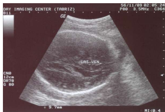
شکل ۳: یافته غیرطبیعی مورد گزارش، حداکثر اندازه بطن‌های طرفی مغز جنین در ناحیه آتریوم با ضخامت ۱۰ mm

در توده‌های بزرگتر از ۲ cm احتمال مرگ جنین بیشتر است. ۱۱ در گزارش حاضر، اندازه توده کوچکتر از ۲ cm بوده و علائمی از آریتمی و مایع پریکاردی و مایع جنبی و آسیت مشاهده نشد. در