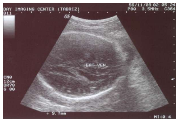
شکل ۳: یافته غیرطبیعی مورد گزارش، حداکثر اندازه بطن‌های طرفی مغز جنین در ناحیه آتریوم با ضخامت ۱۰ mm

در توده‌های بزرگتر از ۲ cm احتمال مرگ جنین بیشتر است. ۱۱ در گزارش حاضر، اندازه توده کوچکتر از ۲ cm بوده و علائمی از آریتمی و مایع پریکاردی و مایع جنبی و آسیت مشاهده نشد. در