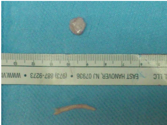
شکل ۴: غضروف‌های خارج شده دنده (پایین) و گوش (بالا)