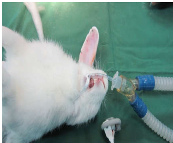
شکل ۱: لوله‌گذاری اندوتراکتال در خرگوش

آنتی‌بیوتیک پروفیلاکتیک انروفلوکساسین ۵ mg/kg عضلانی یک دوز تزریق گردید. تحت بیهوشی عمومی و پس از لیگاتور شریان و