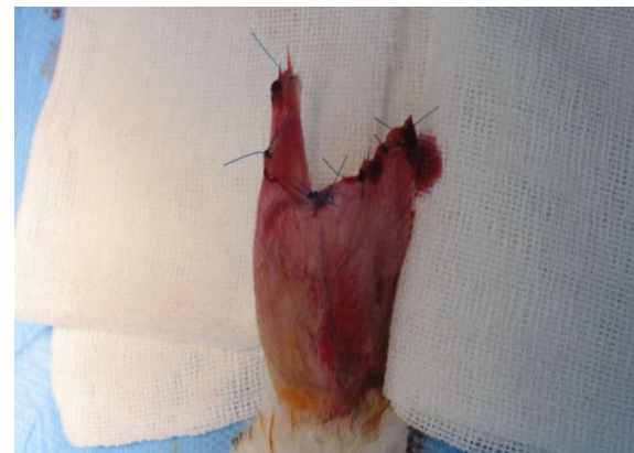
شکل ۳: برداشتن غضروف گوش

از غضروف جدا شده عکسبرداری انجام شد (شکل ۴). هر چند افزون بر وزن غضروف و باقی‌ماندن حجم و فرم آن در جراحی پلاستیک اهمیت زیادی دارد، در این مطالعه فقط وزن آن‌ها اندازه‌گیری شد و داده‌های در فرم مربوطه ثبت شد. نمونه‌ها در محلول فرمالین ۱۰٪ فیکس شد و جهت بررسی پاتولوژی فرستاده شد. در ادامه نمونه‌ها برش داده شده و رنگ‌آمیزی به روش هماتوکسلین و انوزین (H&E) انجام شد و نمونه‌ها از نظر میزان کندروسیت‌های زنده و فیروز توسط پاتولوژیست مورد بررسی قرار گرفت. نتایج حاصل از بررسی در هر یک از انواع گرفت‌ها در فرم‌های ویژه ثبت شد و سپس توسط SPSS software version 19 (IBM SPSS, Armonk, NY, USA) تحلیل گردید.