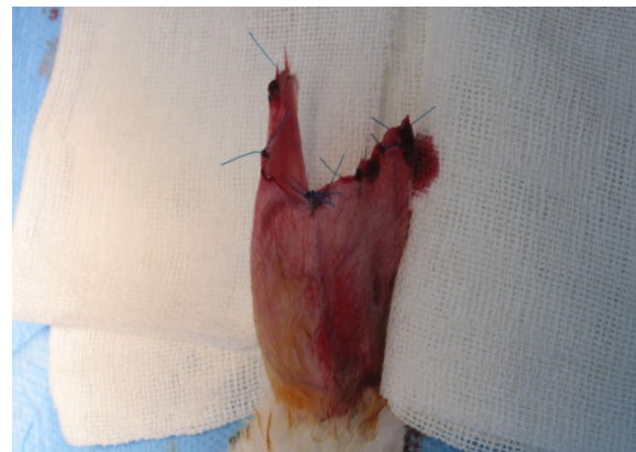
شکل ۳: برداشتن غضروف گوش

از غضروف جدا شده عکسبرداری انجام شد (شکل ۴). هر چند افزون بر وزن غضروف و باقی‌ماندن حجم و فرم آن در جراحی پلاستیک اهمیت زیادی دارد، در این مطالعه فقط وزن آن‌ها اندازه‌گیری شد و داده‌های در فرم مربوطه ثبت شد. نمونه‌ها در محلول فرمالین ۱۰٪ فیکس شد و جهت بررسی پاتولوژی فرستاده شد. در ادامه نمونه‌ها برش داده شده و رنگ‌آمیزی به روش هماتوکسلین و انوزین (H&E) انجام شد و نمونه‌ها از نظر میزان کندروسیت‌های زنده و فیروز توسط پاتولوژیست مورد بررسی قرار گرفت. نتایج حاصل از بررسی در هر یک از انواع گرفت‌ها در فرم‌های ویژه ثبت شد و سپس توسط SPSS software، version 19 (IBM SPSS, Armonk, NY, USA) تحلیل گردید.