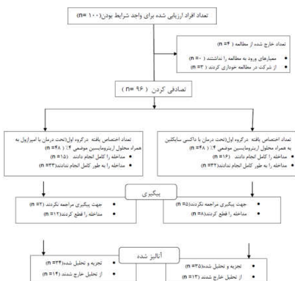
شکل ۱: فلوجارت بیماران

اریترومیسین موضعی ۴٪، به مدت سه ماه تحت درمان قرار گرفتند. تمامی بیماران از نظر هلیکوباکتریلوری آزمایش شدند تا پایان مطالعه از نظر ارتباط با درمان مورد بررسی قرار گیرند.