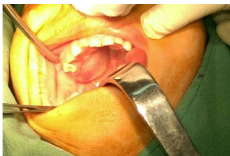
شکل ۱: نمای کلینیکی با تورم در خلف پالاتال فک بالا سمت راست بیمار