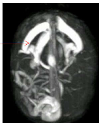
شکل ۲: سیستم وریدی متسع در MRV

مالفورماسیون شریانی- وریدی مغزی آنومالی‌های عروقی نادری هستند. نارسایی احتقانی قلبی در دوره نوزادی در بیشتر موارد ناشی از نقایص ساختمانی قلب است. از این‌رو در صورت مواجه شدن با شواهد نارسایی قلبی در دوره نوزادی در ابتدا باید علل شایعتر آن را رد نمایم و در نهایت بررسی از نظر مالفورماسیون شریانی- وریدی مغزی انجام گیرد. همانند نوزاد مورد مطالعه ما به‌ندرت اولین سرخ تشخیصی می‌تواند به صورت یک الگوی غیرطبیعی ضربان قلبی جنین و عدم واکنش آزمون غیر استرس باشد. مشابه با مطالعه ما ممکن است یک ارتباط دو طرفه بین نقص دیواره دهلیزی و مالفورماسیون شریانی- وریدی مغزی وجود داشته باشد. نوزادان مبتلا به مالفورماسیون شریانی- وریدی مغزی که به صورت نارسایی احتقانی قلبی در روزهای اول تولد تظاهر می‌یابد پیش‌آگهی بسیار بدی داشته و اغلب پیش از هرگونه درمان قطعی فوت می‌کنند. بنابراین تشخیص زودرس و انجام مداخله درمانی پیش از رسیدن به مرحله برگشت‌ناپذیر بسیار دارای اهمیت می‌باشد.