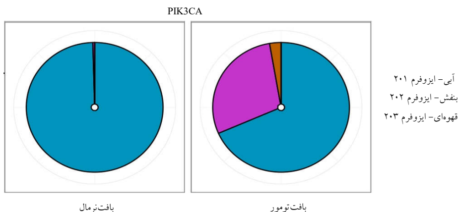
شکل ۱: ایزوفرم‌های بیان شده ژن PIK3CA در بافت تومور و نرمال مثانه

ایزوفرم‌های ژن PIK3CA در بافت تومور و نرمال در شکل ۱ نشان داده شده است. همانطور که مشاهده می‌شود در بافت نرمال فقط ترنسکریپت بزرگ‌تر و اصلی بیان می‌گردد، در صورتی که در بافت تومور سه ایزوفرم با نسبت‌های مختلف بیان شده‌اند که نشان دهنده تفاوت در بیان ایزوفرم‌ها در بافت سرطانی می‌باشد. ایزوفرم‌های ژن FGFR3 در شکل ۲ نمایش داده شده است. در بافت