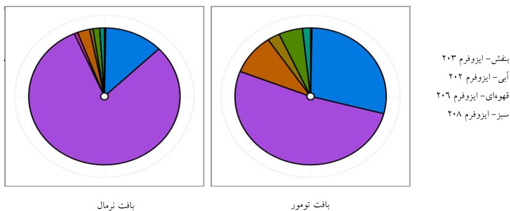
شکل ۲: ایزو فرم‌های بیان شده ژن FGFR3 در بافت تومور و نرمال مثانه