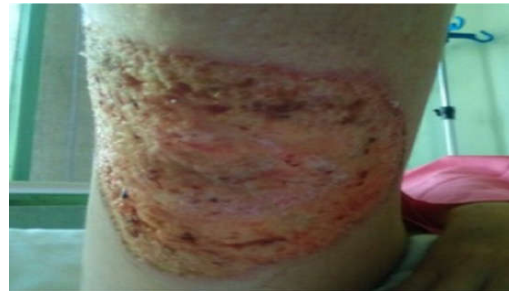
شکل ۳: ضایعه چند روز پس از شروع کورتون، بهبود تدریجی ضایعه پس از شروع کورتیکواستروئید