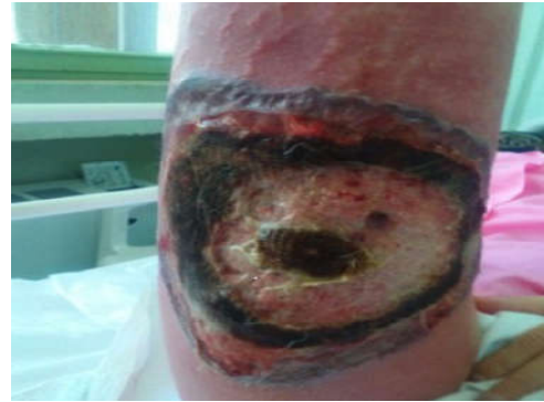
شکل ۲: پیشرفت ضایعه در طی بستری بیمار، افزایش تدریجی وسعت زخم با وجود دبریدمان سطحی ضایعه

دستگاه تناسلی، در اندام تحتانی در قسمت میانی سطح ران‌های بیمار هم ایجاد شده بود که به سرعت هم پیشرونده بود. تظاهرات بالینی ناحیه PG پس از عمل ممکن است مشابه نکروز فاشیا باشد که جهت افتراق آن با PG، حال عمومی به نسبت خوب بیمار، میزان تب پایین، کشت میکروب‌شناسی منفی زخم و همچنین پاسخ نامناسب به درمان آنتی‌بیوتیکی کمک‌کننده است، همچنین بیمار PG بدون علائم عمومی سپسیس است. از موارد دیگر تشخیص افتراقی ضایعه PG، هیدرادنیت چرکی و عفونت‌های تب خالی را می‌توان بیان کرد. ۸