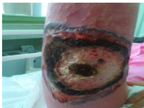
شکل ۲: پیشرفت ضایعه در طی بستری بیمار، افزایش تدریجی وسعت زخم با وجود دبریدمان سطحی ضایعه

دستگاه تناسلی، در اندام تحتانی در قسمت میانی سطح ران‌های بیمار هم ایجاد شده بود که به سرعت هم پیشرونده بود. تظاهرات بالینی ناحیه PG پس از عمل ممکن است مشابه نکروز فاشیا باشد که جهت افتراق آن با PG، حال عمومی به نسبت خوب بیمار، میزان تب پایین، کشت میکروب‌شناسی منفی زخم و همچنین پاسخ نامناسب به درمان آنتی‌بیوتیکی کمک‌کننده است، همچنین بیمار PG بدون علائم عمومی سپسیس است. از موارد دیگر تشخیص افتراقی ضایعه PG، هیدرادنیت چرکی و عفونت‌های تب خالی را می‌توان بیان کرد. ۸