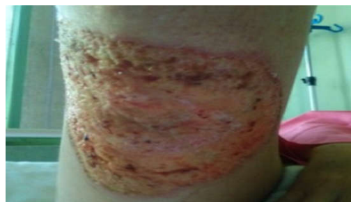
شکل ۳: ضایعه چند روز پس از شروع کورتون، بهبود تدریجی ضایعه پس از شروع کورتیکواستروئید

علائم کلینیکی و آزمایشگاهی بیماران PG غیراختصاصی است و تشخیص بر اساس رد سایر علل بیماری و نتیجه بیوپسی برداشته شده از ضایعه است. همیشه در این بیماران باید بیماری زمینه‌ای سیستمیک را بررسی کنیم. ۹ گزارش شده است که زن ۴۷ ساله با ضایعات دهانی و زخم ناحیه پرینه مشابه سندروم بهجت مراجعه کرده بود و بیوپسی ضایعه پوستی پرینه PG تشخیص داده شد و بیمار با درمان کورتیکواستروئید و آمینوسالسیلیک اسید بهبود یافت. همچنین در مطالعه روی ۱۳ بیمار مبتلا به PG با سابقه کولیت اولسروز، در شش بیمار به علت ترومای جراحی در محل، ضایعات پوستی ایجاد شد که با درمان کورتیکواستروئید سیستمیک بهبود پیدا کرد. ۱۰ در بررسی مقالات در مطالعه Cohort توسط Thomas و همکاران، ۷۵٪ مبتلایان به کرون مبتلا به PG شده بودند. ۹ از نظر