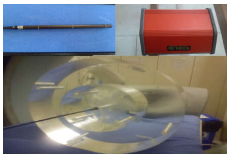
شکل ۱: الف) اتاقک یونیزان قلمی مدل DCT10 به کار رفته در این پژوهش، ب) مولتی متر باراکودا، ج) فانتوم استاندارد تنه با قطر ۳۲ cm از جنس پرسپکس

اندازه‌گیری و میانگین آن برای مقایسه در نظر گرفته شد. از آزمون Kolmogorov-Smirnov به منظور تعیین نرمال بودن داده‌ها استفاده شد. از آزمون Independent samples t-test به منظور برآورد سطح معناداری اختلاف بین CTDI w و نویز اندازه‌گیری شده بین دو گروه با و بدون سیستم کنترل خودکار تابش‌دهی استفاده شد. تمامی تجزیه و تحلیل‌های آماری توسط SPSS software, version 21 (SPSS Inc., Chicago, IL, USA) انجام شد. در هر مورد P < 0.05 به عنوان سطح معناداری در نظر گرفته شد.