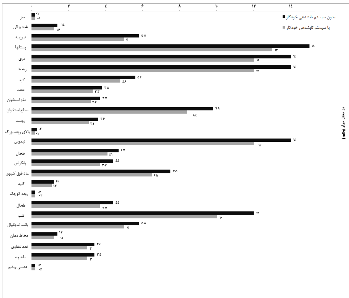
نمودار ۲: مقایسه دوز در اندام‌های مختلف در دو پروتکل با و بدون سیستم کنترل خودکار تابش دهی

گردنی گزارش شده است. ۲۰ Brisse و همکاران مطالعه‌ای تجربی با استفاده از فانتوم استاندارد بر روی آزمون‌های مختلف سی تی اسکن اطفال انجام دادند. در این مطالعه دوز ارگان‌های مختلف در دو حالت با و بدون سیستم کنترل خودکار تابش دهی برآورد و با هم مقایسه شد. ۲۱ نتایج این پژوهش نشان می‌دهد استفاده از سیستم کنترل خودکار تابش دهی باعث کاهش دوز در اندام‌های تیروئید (از ۶۱٪ به ۳۱٪)، ریه (از ۳۷٪ به ۲۱٪)،