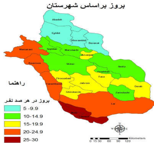
نقشه ۱: بروز نقص آنزیم G6PD بر اساس شهرستان در استان فارس بین سالهای ۱۳۹۰ تا ۱۳۹۴

بر اساس نتایج پژوهش کنونی میزان بروز نقص آنزیم G6PD در نوزادان استان فارس با استفاده از آزمون غربالگری ۱۵/۸۵٪ تولد زنده (نوزادان پسر ۱۶/۲۵٪ و دختر ۱۴/۸۵٪) برآورد شد. در مطالعه‌ای که توسط Kazemi و همکاران در تهران انجام شد بروز نقص آنزیم G6PD در کل نوزادان ۲/۲٪ تولد زنده برآورد شد. Nourbakhsh و همکاران بروز این نقص در نوزادان تازه متولد شده در شهرکرد را