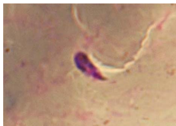
شکل-۲: اووکینت موجود در خون خورده شده در معده پشه‌های An. stephensi mysorensis به روش in vivo (۲۰ ساعت پس از آلودگی)

از آنجائیکه مالاریای انسانی تنها از طریق گزش پشه آلوده امکان‌پذیر است، لذا بلوک کردن سیکل انتقال اقدام کنترل‌کننده مؤثری خواهد بود. با این حال هنوز یک مکانیسم صحیح از روشهای بلوک‌کننده انتقال در دست نمی‌باشد و این مسأله بیشتر به خاطر ملکولهای هدف، که لازمه رشد انگل در بدن میزبان می‌باشد و هنوز به درستی شناخته نشده‌اند، می‌باشد هر چند که ممکن است فاکتورهای رفتاری و اکولوژیکی تا حدودی مسئول این موضوع باشند اما فاکتورهای ژنتیکی، بیوشیمیایی و فیزیکی نقش اصلی را در آلودگی‌های پائین‌بازی می‌نمایند. ۱۰ مطالعات آزمایشگاهی نشان می‌دهد پشه‌هایی که به عنوان ناقلین مهم مالاریا مطرحند مثل An. gambiae بشکل مؤثری بیش از ۹۹/۹٪ رشد انگلهای بلعیده شده را بلوک کرده، در حالیکه گونه‌های مقاوم قادرند این کار را تا ۱۰۰٪ انجام دهند. ۱۳ این مطالعه نشان می‌دهد که An. Stephensi mysorensis در ایران قادر است ۹۳/۹۱٪ رشد انگل‌های بلعیده شده را بلوک نماید. ۱۳ بنابراین می‌توان با اطمینان اظهار کرد که پشه‌ها به شکل ژنتیکی نسبت به پلاسمودیوم مقاومند لذا این مسئله دال بر موانع رشد انگل در پشه هاست که در صورت شناخته شدن ما را در پیشرفت اقدامات مؤثر علیه مالاریا و کنترل آن، رهنمون خواهد کرد. تا کنون سیکل اسپروگونی انگل مالاریا به شکل گسترده‌ای مورد مطالعه قرار گرفته و بسیاری از فاکتورهایی را که بر روی رشد انگل در معده پشه تأثیر می‌گذارند، شرح داده شده است. ۱۴-۱۶ این سیکل در An. stephensi برای انگل P. vivax توسط Nanda و همکاران در سال ۱۹۸۵ مورد مطالعه قرار گرفت. ۱۷