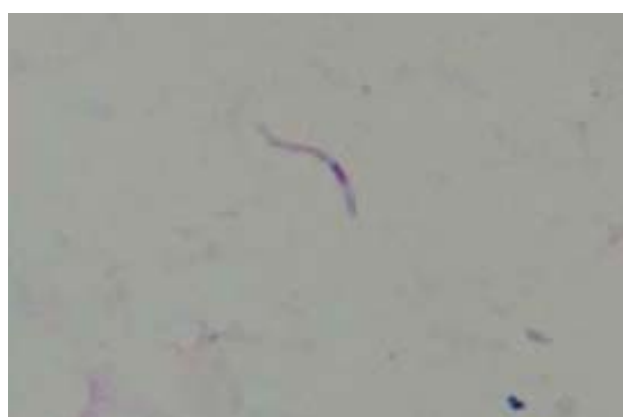
شکل-۳: اسپروزوتیهای مشاهده شده در غدد بزاقی An. stephensi mysorensis (۶ تا ۸ روز پس از آلودگی)