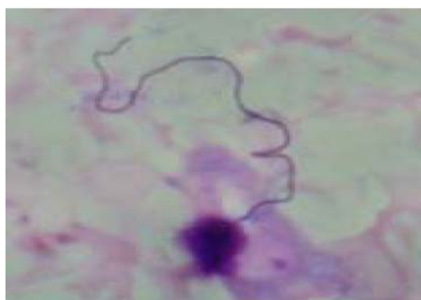
شکل-۱: پدیده آگزفلاژیشن در خون خورده شده در معده پشه‌های An. stephensi mysorensis به روش in vivo (۲ تا ۲ دقیقه پس از آلودگی)