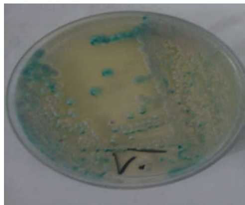
شکل ۵: کلنی میکس کاندیدا آلیکنس و کاندیدا گلابراتا بر روی محیط کروم آگار

با توجه به Fisher exact test ارتباط معناداری میان ابتلا به کاندیدیازیس واژینال با دیابت و مصرف آنتی‌بیوتیک به صورت طولانی مدت وجود داشت. در مطالعه Esmailzadeh و همکاران هم که بر روی نمونه ۲۰۰۰ زن با علائم کاندیدیازیس واژینال انجام شد، ۴۳/۳٪ نمونه‌های بیماران با کشت مثبت از نظر میکروسکوپی هم مثبت بود. ۱۶ برخی از پژوهشگران این اختلاف حساسیت در نتایج مشاهده لام مستقیم را به دلیل اختلاف تراکم مخمرها در ترشحات واژن بیان نموده‌اند. ۱۷، ۱۸ در مطالعه اخیر با توجه به Chi-square test