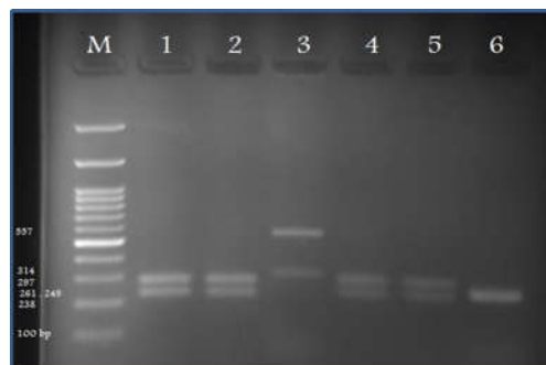
شکل ۶: نمونه‌ای از نتایج الکتروفورز PCR-RFLP پس از هضم آنزیمی توسط آنزیم MSPI

M: DNA Ladder; 1, 2, 4, and 5: Candida albicans ; 3: Candida glabrata ; Candida krusei 6