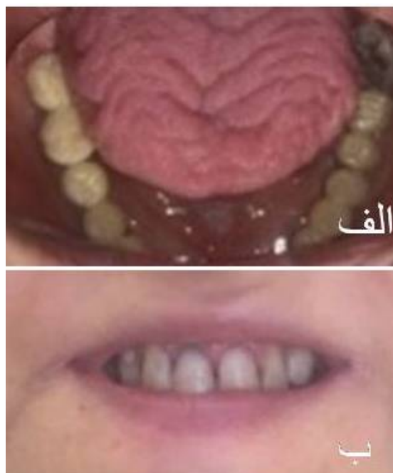
شکل ۱: الف- زبان شیاردار، ب- شقاق لب و دندان‌ها با ترمیم‌های کامپوزیت معیوب

اسکلروداکتیلی یا سفتی پوست اندام‌ها و تلائژکتازی نیز مشاهده نشد. نتیجه بررسی‌های آزمایشگاهی و پاراکلینیک به شرح زیر بود: هموگلوبولین: ۱۱/۸ g/dl، کورتیزول پایه سرم کاهش یافته (هشت صبح): ۴/۸ mg/dl (مقدار طبیعی: ۳۰-۲۳۰)، هورمون آدرنوکورتیکوتروپین افزایش یافته: ۳۲ pmol/l (مقدار طبیعی: ۱/۶-۱۳/۹)، فقدان افزایش