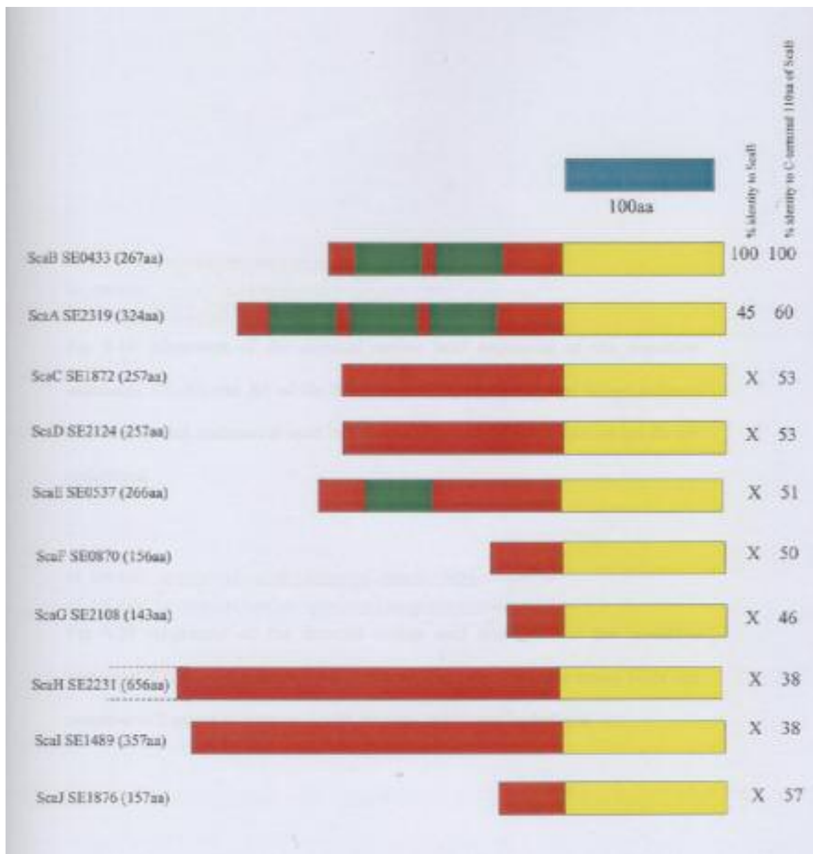
شکل ۱- تصویر شماتیک پروتئین‌های خانواده اسکا (Sca) در استافیلوکوکوس اپیدرمیدیس.

در این تصویر ۱۱۰ اسیدآمینو بخش C ترمینال پروتئین‌ها به همراه بخش‌های LysM نمایش داده شده است. برای مثال ScaB دارای ۲ بخش LysM می باشد. علامت X به معنای برابر بودن همولوژی پروتئین با بخش C ترمینال است.