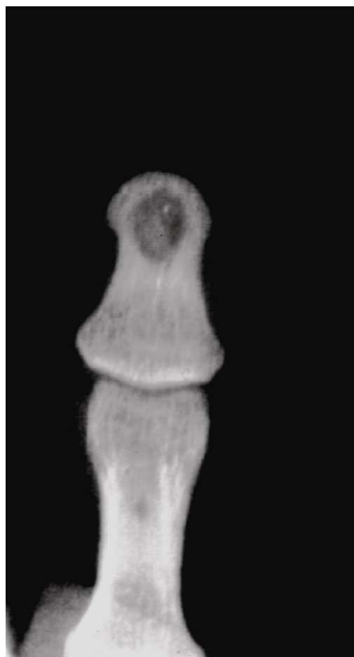
شکل ۳- ضایعه لیتیک در بند دیستال. تشخیص قبل از عمل اپیدرموئید کیست بوده است.