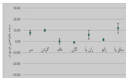
شکل ۴: منحنی مقادیر درصد یکنواختی توزیع دوز در عمق میانی برای فوتون‌های ۱۸MV در هندسه AP/PA و مقادیر انحراف استاندارد

درصد تفاوت میان دوز تجویز شده به نقطه مرجع و دوز اندازه‌گیری شده برابر با ۲/۷۳٪- به دست آمد. این تفاوت می‌تواند به این علت باشد که مقدار آهنگ دوز و دوز عمقی در محیط همگن اندازه‌گیری شد اما محیط بدن و فانتوم شبه انسان یک محیط ناهمگن متشکل از انواع بافت‌های نرم و استخوان می‌باشد. با این حال دوز