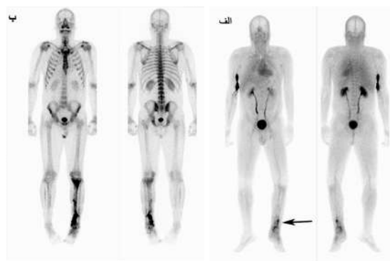
شکل ۳: تابلو الف اسکن گلبول سفید نشان‌دار شده با تکنزیوم HMPAO و با اسکن استخوان همان بیمار را با عفونت پس از عمل جراحی درشت‌نی نشان می‌دهد. فلش سیاه رنگ نشان‌دهنده تجمع گلبول سفید نشان‌دار و موید عفونت است.

بررسی‌های In-vivo روی تصاویر لازم است همواره انجام پذیرد. یکی از این بررسی‌ها آزمون جذب ریوی است که توصیه می‌گردد