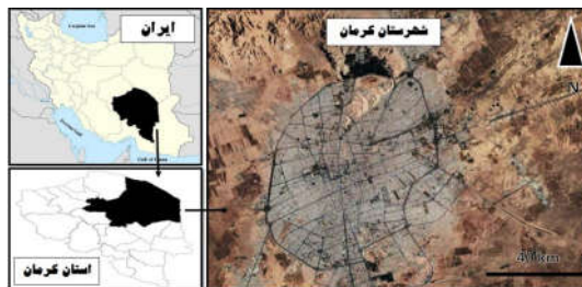
شکل ۱: نقشه محل مورد مطالعه، شهر کرمان، استان کرمان، جنوب شرقی ایران

از مجموع ۲۸۵۰ دانش‌آموز که توسط پژوهشگر معاینه شدند ۱۷۹ عدد پرسشنامه تکمیل گردید، ۱۱۹ دانش‌آموز از ناحیه یک آموزش و پرورش ( 10/08 \pm 0/027 ) و ۶۰ دانش‌آموز از ناحیه دو