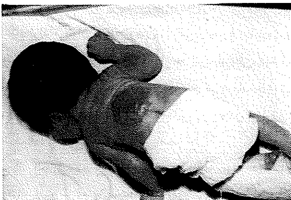
تصویر شماره ۳- بیمارستان میرزا کوچک خان، نوع ناهنجاری: مننگوسل، جنس: پسر