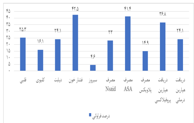
نمودار ۱: توزیع فراوانی بیماری‌های زمینه‌ای و داروهای مصرفی بیماران مورد مطالعه