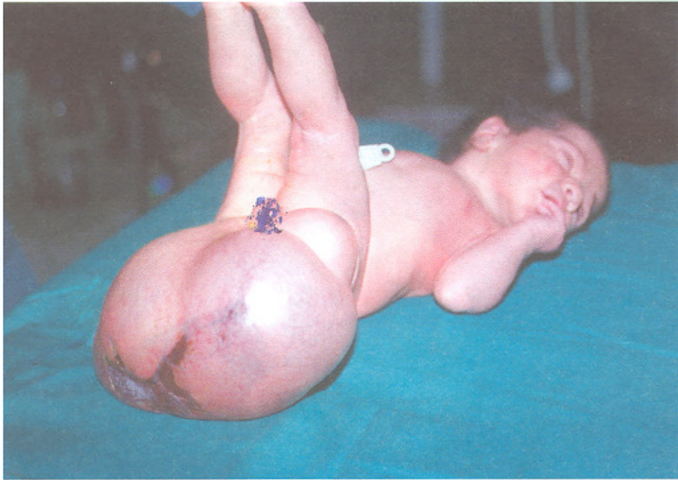
تصویر شماره ۱ - تراتومای کیستیک SC در بیماران بیمارستانهای دانشگاه علوم پزشکی تهران (۱۳۶۱ تا ۱۳۷۸)