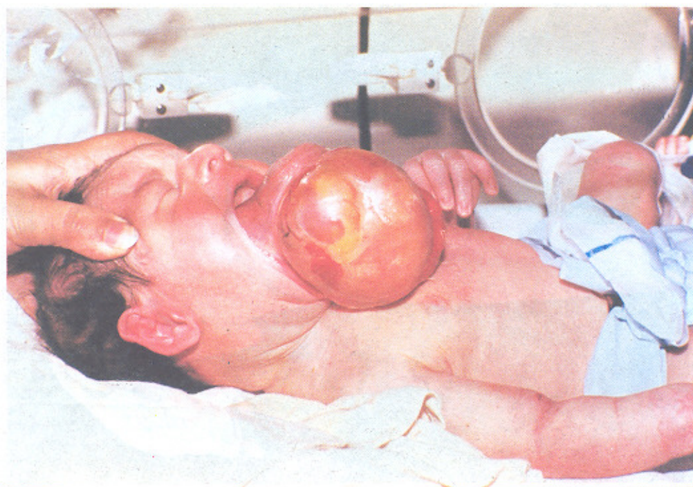
تصویر شماره ۴ - ترانومای بزرگ دهانی در بیمارستانهای دانشگاه علوم پزشکی تهران (۱۳۶۱ تا ۱۳۷۸)