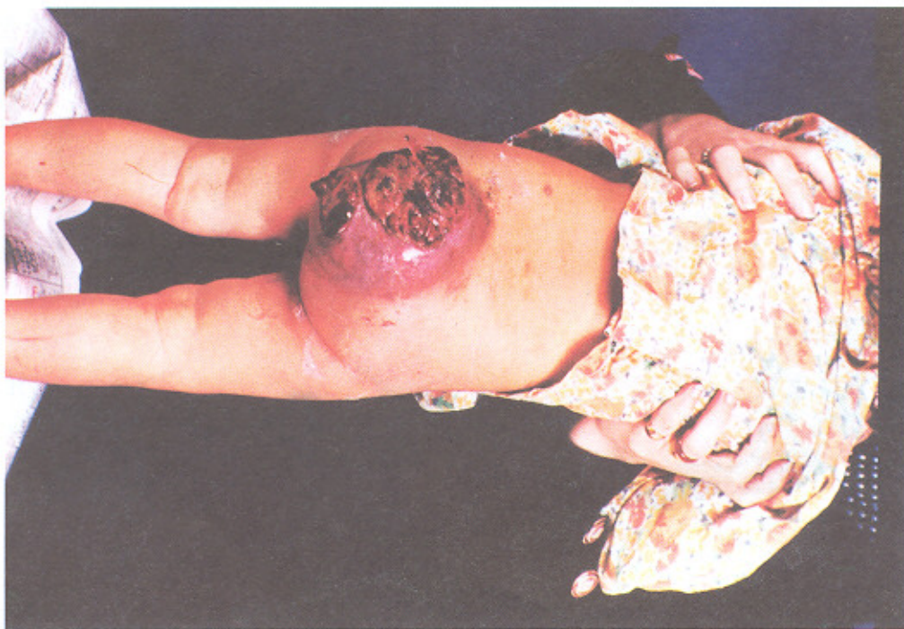
تصویر شماره ۲ - تراتومای بدخیم SC در بیماران بیمارستانهای دانشگاه علوم پزشکی تهران (۱۳۶۱ تا ۱۳۷۸)