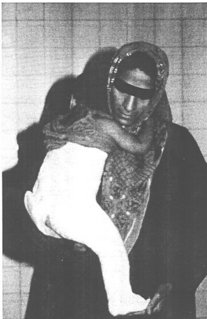
شکل ۳- گچ اسپیکا با خم کردن زانو و مفصل ران بمیزان

۹۰ درجه که بغل کردن بهار برای والدین راحت تر باشد.