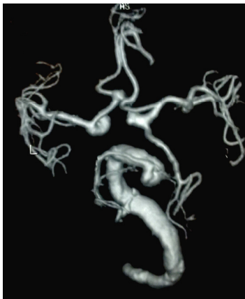
شکل-۳: Magnetic Resonance Angiography. شریان‌های رتبروبازیلار پر پیچ و خم و متسع مشاهده می‌شود