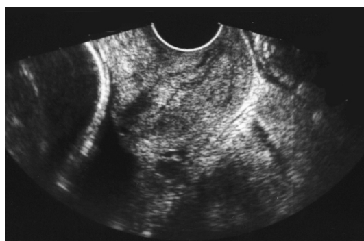
شکل-۲: سونوگرافی از مناطق هیپواکو غدد سرویکس