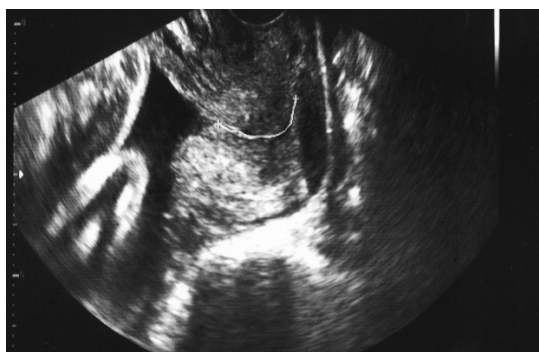
شکل-۴: سونوگرافی از مناطق ایزواکو سرویکس