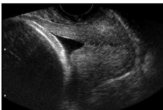
شکل-۵: Funneling سرویکس در سونوگرافی واژینال، غدد دیده نمی‌شود.