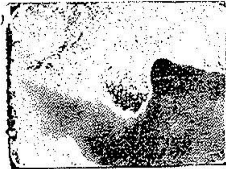
پرتو نگاری شماره ۳

ولی این اختفا کامل نبود سطح جوته دندان تماس با سطح دیستال دندان آسیای دوم بود. قسمت مزیبال سطح جوته بطوق دندان آسیای دوم کاملاً چسبیده بود بطریقیکه يك قسمت از آن داخل آرواره بنظر میرسید. معمولاً در این حالات دندان آسیای دوم یعنی دندان دوازده سالگی را قبل از کشیدن دندان عقل بیرون میآورند. برای اینکه کشیدن این دندان سهلتر گردد