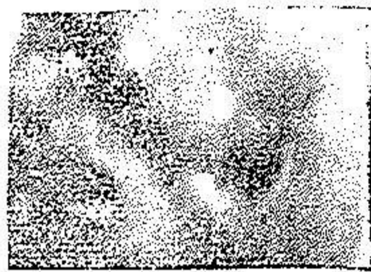
پرتونگاری شماره ۲

گاهی محور دندان داخل آرواره بطرف گونه منحرف شده و خیلی بندرت بطرف زبان میرود و زمانی بطرف عقب شاخه بالا رو آرواره زیرین انحراف پیدا میکند ولی بطور کلی هر قدر محور دندان از خط عمودی منحرف گردد کشیدن آن دندان مشکلتر میشود باینجهت است که انحراف سطح قدامی و جهت خط مورب خارجی و انحراف