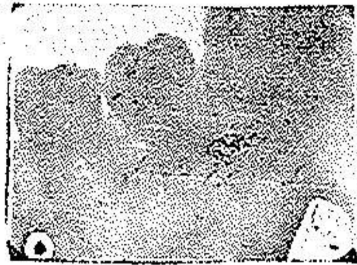
پرتونگاری شماره ۱

قرار دندان و درجه احتقان و انحراف دندان و شکل و حجم تاج و ریشه هارا نشان میدهد پرتونگاریهائیکه اینجانب در این موارد نموده‌ام از فیلمهای داخل دهانی است ولی در صورت ترسیموس میتوان فیلم خارج دهانی بکار برد اگر فیلم را مابین دندانها در سطح جفت گیری و عمود بر محور دندانها قرار دهیم انحراف دندانها بهتر نمایان خواهد شد. بهترین درمان حوادث دندانهای داخل آرواره کشیدن آنهاست.