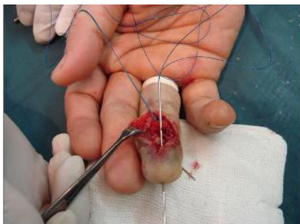
شکل-۴: نحوه عبور دادن نخ لوپ از داخل آنژیوکت

پس از خروج آنژیوکت از ناخن نخ لوپ رد می‌شود و روی دکمه گره‌های متعدد زده می‌شود