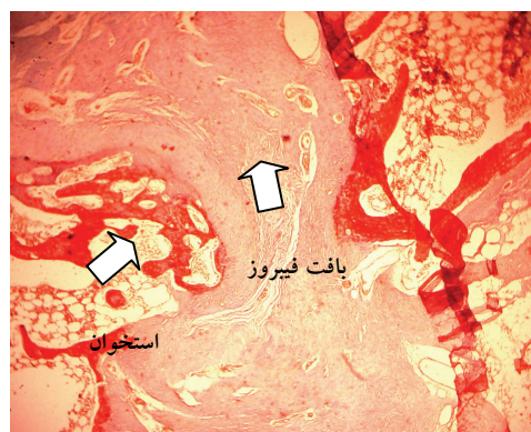
شکل-۱: بافت فیبروز در محل نقص لامینکتومی (رنگ آمیزی H & E)

گرید صفر و یک و پنج خرگوش (۲۶/۳٪) در گرید دو قرار گرفتند و ارتباط معنی‌داری بین استفاده از ژل فوم و میزان فیبروز اپیدورال مشاهده نگردید ( p=0/189 ). در خصوص تعداد سلول‌های فیبروبلاست در گروه با ژل فوم تعداد هشت خرگوش (۴۰٪) در گرید یک و ۱۲ خرگوش (۶۰٪) در گرید دو قرار گرفتند. در گروه بدون ژل فوم هشت خرگوش (۴۲/۱٪) در گرید یک و ۱۱ خرگوش (۵۷/۹٪) در گرید دو قرار گرفتند که ارتباط معنی‌داری بین استفاده از ژل فوم و تعداد سلول‌های فیبروبلاست مشاهده نگردید ( p=0/576 ). در ارتباط با تعداد سلول‌های التهابی در گروه با ژل فوم تعداد ۱۶ عدد خرگوش (۸۰٪) و چهار عدد خرگوش در گرید یک و تعداد چهار خرگوش (۲۰٪) در گرید دو قرار گرفتند. در گروه بدون ژل فوم ۱۴ عدد خرگوش (۷۳/۷٪) در گرید یک و پنج عدد خرگوش (۲۶/۳٪) در گرید دو قرار گرفتند و ارتباط معنی‌داری بین استفاده از ژل فوم و تعداد سلول‌های التهابی مشاهده نگردید ( p=0/465 ).