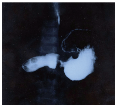
شکل ۱- کلیشه فالوترو: عبور باریم از معده طبیعی، اتساع بولب دوازدهه و ابتدای D 2

بیمار پنجم: پسر ۳/۵ ماهه به علت استفراغ‌های غیر صفراوی پیشرونده که از یک ماه قبل شروع شده بود مراجعه کرد. شیرخوار کاهش رشد داشت و وزن وی در حد ۳/۵ کیلوگرم بود. در گرافی