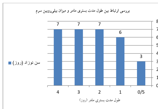
نمودار ۱: ارتباط بین مدت بستری مادر و بیلی‌روبین سرم نوزاد