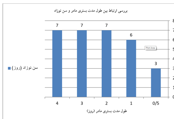
نمودار ۲: بررسی ارتباط بین طول مدت بستری مادر و سن نوزاد

طبیعی میسر نبوده و یا با خطراتی برای جنین یا مادر همراه باشد. در حالی‌که زایمان واژینال منجر به کاهش بستری در بخش مراقبت‌های ویژه نوزادان و کاهش نیاز به اکسیژن نوزادی می‌شود. ۲۰ در یک مطالعه، میانگین مدت بستری در گروه زایمان سزارین کمابیش دو برابر گروه زایمان طبیعی بود. ۲۱ در مطالعه Boskabadi و همکاران، میزان بیلی‌روبین توتال در دو گروه از نوزادان متولد شده به روش‌های سزارین و طبیعی تفاوت معناداری نداشت ولی مدت بستری مادر تفاوت معناداری داشت. میانگین مدت بستری شدن مادر در بیمارستان در گروه سزارین در مقایسه با گروه زایمان طبیعی به‌طور معناداری