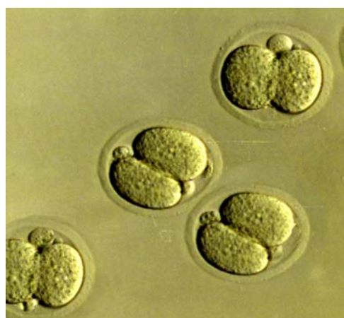
تصویر-۱: جنین‌های به دست آمده در مرحله دو سلولی.