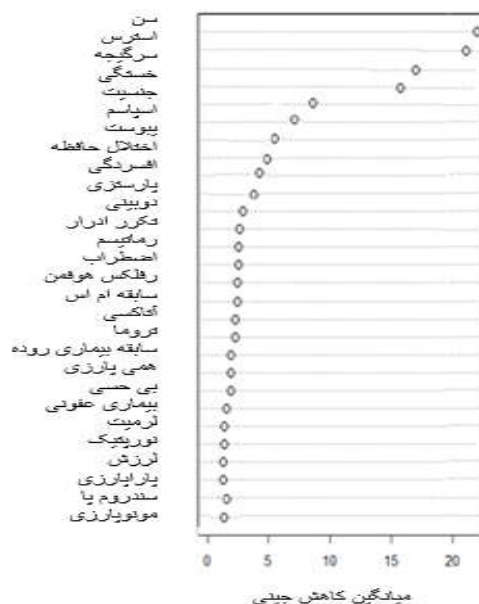
نمودار ۲: تعیین اهمیت متغیرها بر اساس میانگین کاهش جینی

در عرصه‌های پزشکی، همواره ابزاری برای پیش‌بینی وضعیت افراد در ابتلا به بیماری‌ها بر اساس عوامل خطر هر بیماری لازم است تا بتوان امکان پیشگیری به‌موقع و شناخت هرچه بهتر عوامل خطر را فراهم کرد. از سویی در بیشتر بیماری‌ها، شاهد تعداد زیادی از عوامل خطر هستیم که افزون‌بر داشتن اثرات متقابل با یکدیگر، دارای اثرات غیرخطی نیز هستند. ۳۳ به‌منظور شناسایی، تحلیل و بررسی این‌گونه اثرات و یافتن روابط غیرخطی میان آن‌ها، باید از ابزارهایی ویژه بهره برد. ابزاری که بتواند از انبوه داده‌های موجود الگوهای قابل توجه را